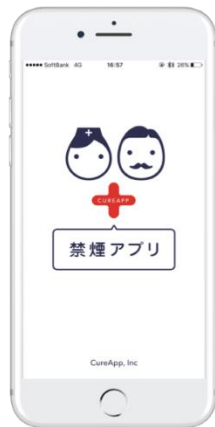
ニコチン依存症治療用アプリ

■非アルコール性脂肪肝炎(NASH)治療アプリ:東京大学医学部附属病院との共同研究。昨年10月から臨床研究を進行中。